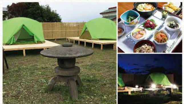
*亦能夠介紹農家民宿。歡迎洽詢詳情。

金木元氣村內備有露營場，以供遊客加倍享受鄉間生活的樂趣。在盡情享受附近的大自然後，夜宿在星空下的帳篷中，必定能夠令這趟旅遊增添更多趣味。晚餐可於「茶房 鄙家」享用鄉土料理，沐浴則可利用鄰近的元氣村木屋。蟲鳴環繞，月光星光灑落，定會讓您在此留下一份美好回憶！