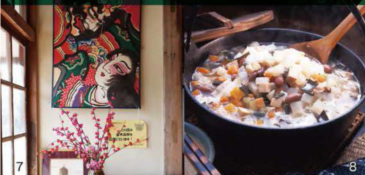
5.「茶房 鄙家」是將金木元氣村「KADARUBE」內具有 140 年歷史的古民房整修而成。專門研發並銷售使用當地農畜產品製作的鄉土料理、點心。6.「茶房 鄙家」的圍爐。可以在此烤魚、煮火鍋。7.「茶房 鄙家」的一隅。8.「粥汁」是津輕地區的居民在入冬後特別喜愛的鄉土料理。使用的基本食材包括白蘿蔔、紅蘿蔔、牛蒡等青菜類以及鋒斗菜、蕨菜、薇菜等山菜類，以及炸豆皮、豆腐、凍豆腐等大豆製品。將所有食材切丁後燉煮，並以味噌、醬油調味，是道樸實的當地料理。